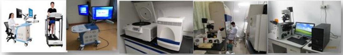
关节三维步态分析平台